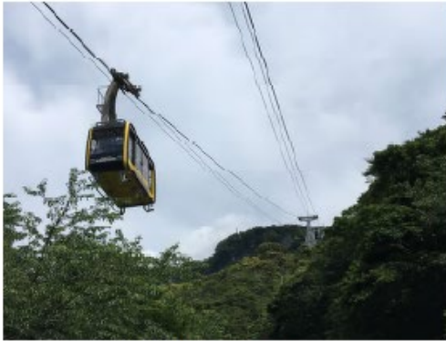
鋸山ロープウェイ