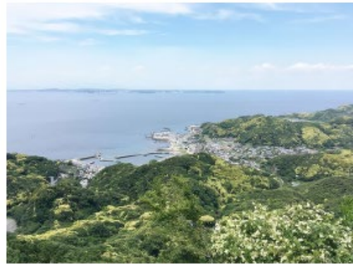
十州一覽台から東京湾